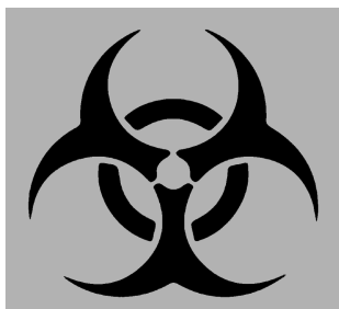
图 1 生物危险符号的绘制方法